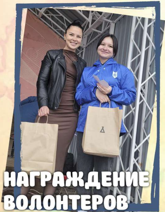
НАГРАЖДЕНИЕ ВОЛОНТЕРОВ ПРОФКОМА ГАГУ