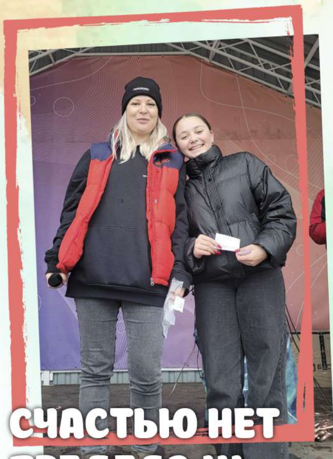
СЧАСТЬЮ НЕТ ПРЕДЕЛА!!!