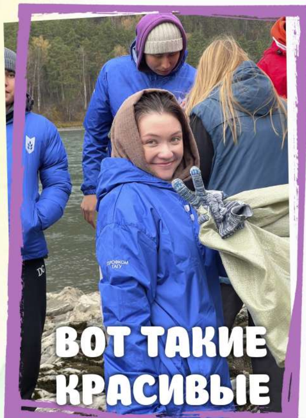
ВОТ ТАКИЕ КРАСИВЫЕ ДЕВЧОНКИ!!!